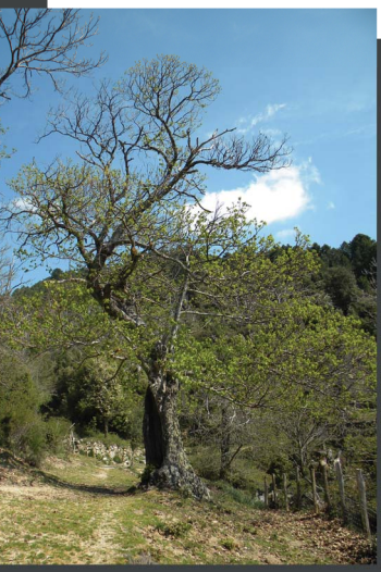
un chataîgner (u castagnu)

Celle-ci s'obtenait grâce à un authentique moulin à eau auquel on apportait des châtaignes qui étaient préalablement passées par le séchoir traditionnel permettant la conservation des fruits.