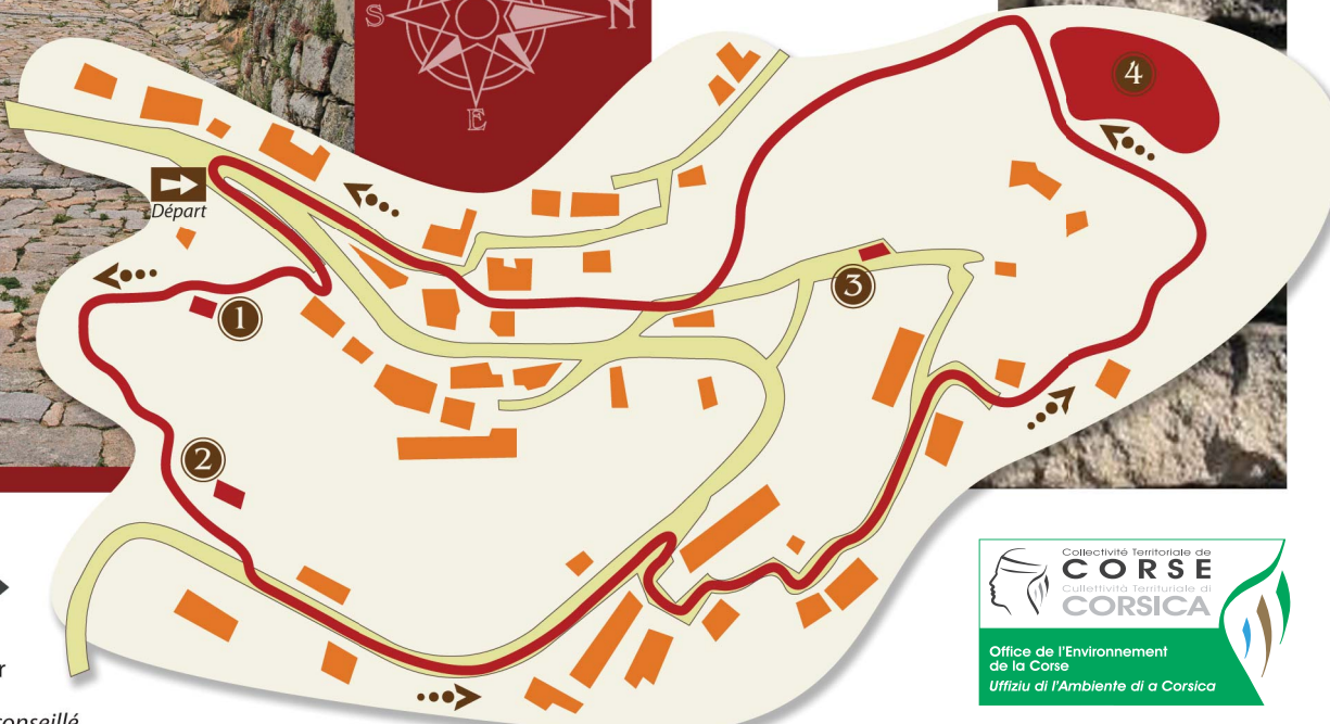
1 Séchoir à châtaigne "u Siccatoaghju"